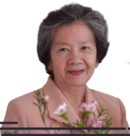
ศ.ดร.พัชรี ฝายอิน